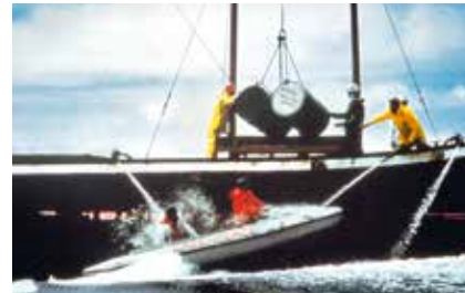
1981 – Aktion gegen Atommüllversenkung

1982 Die IWC beschließt das Verbot des kommerziellen Walfangs ab 1986. ▶ Krach im deutschen Büro über den Führungsstil: Einige Ehrenamtliche steigen aus und gründen Robin Wood.