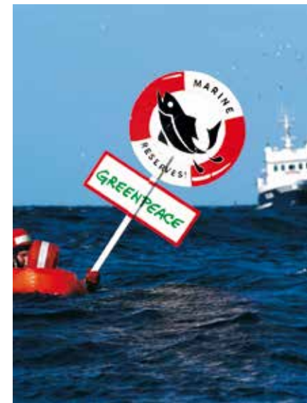
2004 – Einsatz für den Meeresschutz