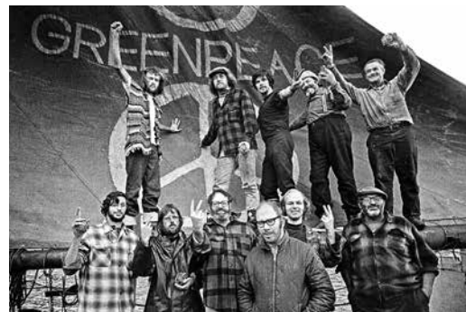
1971 – Erster Greenpeace-Protest gegen Atomtests