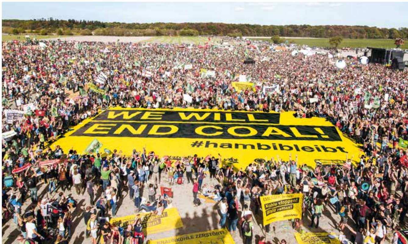
2018 – Zehntausende protestieren am Hambacher Wald für Klimaschutz und feiern den vorläufigen Rodungsstopp

2020 90 Gebiete in Deutschland haben nach Erkenntnissen der Bundesgesellschaft für Endlagerung günstige geologische Voraussetzungen für ein Atommüllendlager. Gorleben ist nicht darunter. Jahrzehntlang hatten Umweltschützer und Geolog:innen auf Sicherheitsmängel hingewiesen – nun ist amtlich: Gorleben ist als Endlager ungeeignet. ▶ Die Automobilbranche geht bei der finanziellen Unterstützung anlässlich der Covid-19-Pandemie trotz vehementer Forderungen beim Verkauf von Verbrennerfahrzeugen leer aus. ▶ Mehr wilde Wälder in Bayern! Auf nun insgesamt 58.000 Hektar wird die Natur sich selbst überlassen, eine Fläche sieben Mal so groß wie der Chiemsee. Der Haken: 98 Prozent der Flächen sind winzig! Zusätzlich braucht es große Naturwälder ohne Baumfällungen im Spessart und Steigerwald. ▶ Die Bundesregierung verlängert ihr Waffenexportembargo gegen Saudi-Arabien um ein Jahr und widerruft bereits bestehende Genehmigungen. Alle Rüstungslieferungen, die seit dem Exportstopp im Jahr 2018 on hold waren, werden nicht mehr weiter durchgeführt.