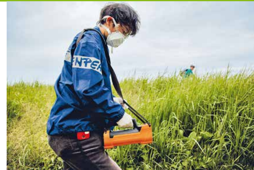
2011 – Nach dem Super-GAU im japanischen Atomkraftwerk Fukushima misst ein Greenpeace-Strahlenexperte die radioaktive Kontamination

2011 Im japanischen AKW Fukushima Daiichi kommt es zum atomaren Super-GAU. Greenpeace entsendet ein internationales Expertenteam, um unabhängige Messungen vorzunehmen und die Ergebnisse der Öffentlichkeit zur Verfügung zu stellen. Greenpeace ist bis heute kontinuierlich vor Ort aktiv und setzt Impulse für die Energiewende in Japan. ▶ In Deutschland wird der Atomausstieg beschlossen. ▶ „Der Plan“ ist das Greenpeace-Szenario für einen kompletten Umstieg auf erneuerbare Energien in Deutschland. ▶ Flüsse und Ozeane werden durch Chemikalien belastet, die bei der Textilproduktion verwendet werden. Die Detox-Kampagne beginnt 2011 und erzielt über Jahre einen Erfolg nach dem anderen. Sie ist ein Weckruf für die gesamte Branche und initiiert enorme Veränderungen.