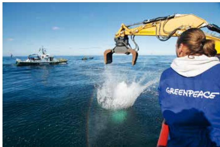
2008 – Greenpeace-Protest für echte Meeresschutzgebiete im Sylter Außenriff

2009 Nach jahrelanger Greenpeace-Kampagne werden in Nordfinnland acht Urwaldgebiete von insgesamt rund 100.000 Hektar unter Schutz gestellt, ein weiteres Schutzgebiet von 150.000 Hektar folgt ein Jahr später. ▶ Die Banken- und Wirtschaftskrise erschüttert auch Deutschland. Als Reaktion auf die milliardenschwere Unterstützung der Bundesregierung für kriselnde Geldinstitute protestieren Greenpeace-Aktivist*innen an der Zentrale der Deutschen Bank in Frankfurt: „Wäre die Welt eine Bank, hättet ihr sie längst gerettet.“ Die Umweltschützer*innen fordern die Bundesregierung auf, mehr Geld in Klimaschutzprojekte in Entwicklungsländern zu investieren. ▶ Greenpeace-Proteste unter dem Motto „Atomkraft schadet Deutschland“ richten sich gegen die Pläne der Energiekonzerne, die Laufzeit der Atommeiler zu verlängern. ▶ Aus für Gen-Mais MON810 in Deutschland.