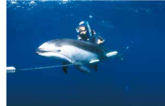
Seit 1983 – Aktionen gegen Treibnetzfischerei

1987 Eine Greenpeace-Antarktisstation wird etabliert. ▶ Greenpeace gründet das „Bergwaldprojekt“ mit, Freiwillige pflanzen Bäume gegen das Waldsterben.