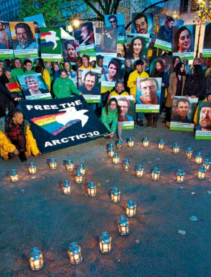
2013 – Proteste gegen Ölbohrungen in der Arktis und für die Freilassung von Aktivist*innen aus russischer Haft

2012 Ein Greenpeace-Schiff kreuzt vor der Westküste Afrikas, Aktivist*innen protestieren gegen die Ausbeutung dortiger Fischgründe durch subventionierte europäische Riesentrawler – die zeitnahe Reaktion: Senegal hebt 29 Fischereilizenzen für nicht afrikanische Trawler auf. ▶ Atomkraftwerke sind gefährlich – über Landesgrenzen hinweg! Greenpeace-Aktivist*innen protestieren auf dem Gelände der schwedischen AKW Forsmark und Ringhals und zeigen so eindrücklich Sicherheitslücken auf. ▶ Greenpeace setzt sich länderübergreifend für den Schutz der Arktis ein.