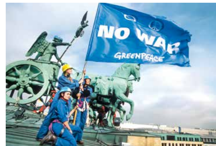
2003 – Greenpeace-Aktion auf dem Brandenburger Tor gegen den drohenden Irakkrieg

2005 Der Ratgeber „Essen ohne Pestizide“ erscheint – auch er wird über die Folgejahre immer wieder aktualisiert und ergänzt. Er sensibilisiert Verbraucher*innen und initiiert Veränderungen auf dem Markt. ▶ Die Kampagne „SOS Weltmeer“ dokumentiert Überfischung sowie Verschmutzung der Meere und fordert echte Schutzgebiete. ▶ Mit einem Dinosaurier aus Schrott touren Greenpeacer*innen durchs Land, sie protestieren gegen die geplante Laufzeitverlängerung für deutsche Atomkraftwerke. ▶ Jahrelang hatte sich Greenpeace gegen Atomtransporte in die sogenannten „Wiederaufarbeitungsanlagen“ in Frankreich und Großbritannien stark gemacht – nun werden sie aus Deutschland eingestellt.