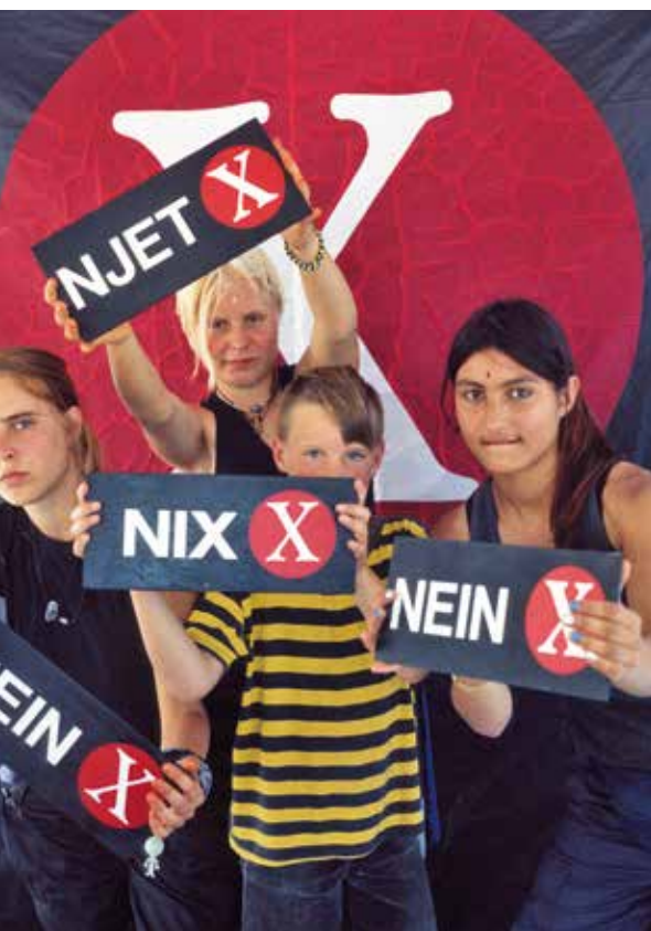
1998 – genetiXproject gegen Gentechnik

2000 Greenpeace deckt auf, dass das Europäische Patentamt (EPA) ein Patent auf die Züchtung menschlicher Embryonen erteilt hat. Aktivist*innen mauern die Eingänge des EPA zu und fordern „Stoppt Patente auf Leben“. ▶ Greenpeace startet eine mehrmonatige Schiffstour in den Amazonas – und in Deutschland protestieren Aktivist*innen an Schiffen, die illegal gefälltes Urwaldholz geladen haben.