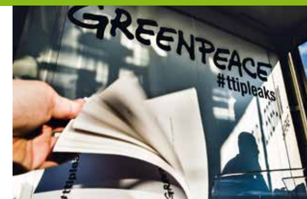
2016 – Einsicht in TTIP-Unterlagen: Ein gläserner Leseraum in Berlin schafft Transparenz

2017 Mit kreativen, friedlichen Protesten lenken Greenpeace-Aktivist*innen bereits Monate vor und während des G20-Gipfels in Hamburg die Aufmerksamkeit auf die zentrale Botschaft: „Planet Earth First“. ▶ Der Outdoor-Ausrüster Gore Fabrics erklärt, die gefährliche Chemikaliengruppe der PFCs ab 2023 aus seinen Gore-Tex-Produkten zu verbannen – ein Erfolg der Detox-Kampagne und ein eindrückliches Signal an die Outdoorbranche. ▶ Der Braunkohlekonzern LEAG gibt den neuen Tagebau Jämschwalde Nord auf – Greenpeace hatte sich mit der Bevölkerung jahrelang dafür eingesetzt. ▶ Millionen Menschen setzen sich mit Greenpeace im Rahmen der „Save the Arctic“-Kampagne gegen die industrielle Ausbeutung der Arktis ein, ein Erfolg: Die EU und neun Staaten einigen sich auf den Schutz des Nordpolarmeers vor der unregulierten, kommerziellen Fischerei, zunächst für 16 Jahre.