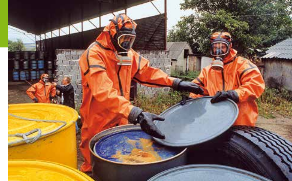
1992 – Giftmüllrückholaktion in Rumänien

1992 Greenpeace entwickelt mit einer ostdeutschen Firma den „Greenfreeze“, den ersten Kühlschrank ohne FCKW und FKW – 1993 läuft der erste Ökokühlschrank vom Band, der „Greenfreeze“ startet seinen weltweiten Siegeszug. ▶ Aktivist*innen bringen dem deutschen Umweltminister radioaktiv kontaminierten Sand aus der Umgebung der britischen „Wiederaufarbeitungsanlage“ Sellafield, die auch deutschen Atomwaste verarbeitet.