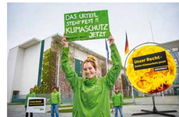
2021 – Freude über den Erfolg vor dem Bundesverfassungsgericht

2020 90 Gebiete in Deutschland haben nach Erkenntnissen der Bundesgesellschaft für Endlagerung günstige geologische Voraussetzungen für ein Atommüllendlager. Gorleben ist nicht darunter. Jahrzehntlang hatten Umweltschützer und Geolog:innen auf Sicherheitsmängel hingewiesen – nun ist amtlich: Gorleben ist als Endlager ungeeignet. ▶ Die Automobilbranche geht bei der finanziellen Unterstützung anlässlich der Covid-19-Pandemie trotz vehementer Forderungen beim Verkauf von Verbrennerfahrzeugen leer aus. ▶ Mehr wilde Wälder in Bayern! Auf nun insgesamt 58.000 Hektar wird die Natur sich selbst überlassen, eine Fläche sieben Mal so groß wie der Chiemsee. Der Haken: 98 Prozent der Flächen sind winzig! Zusätzlich braucht es große Naturwälder ohne Baumfällungen im Spessart und Steigerwald. ▶ Die Bundesregierung verlängert ihr Waffenexportembargo gegen Saudi-Arabien um ein Jahr und widerruft bereits bestehende Genehmigungen. Alle Rüstungslieferungen, die seit dem Exportstopp im Jahr 2018 on hold waren, werden nicht mehr weiter durchgeführt.