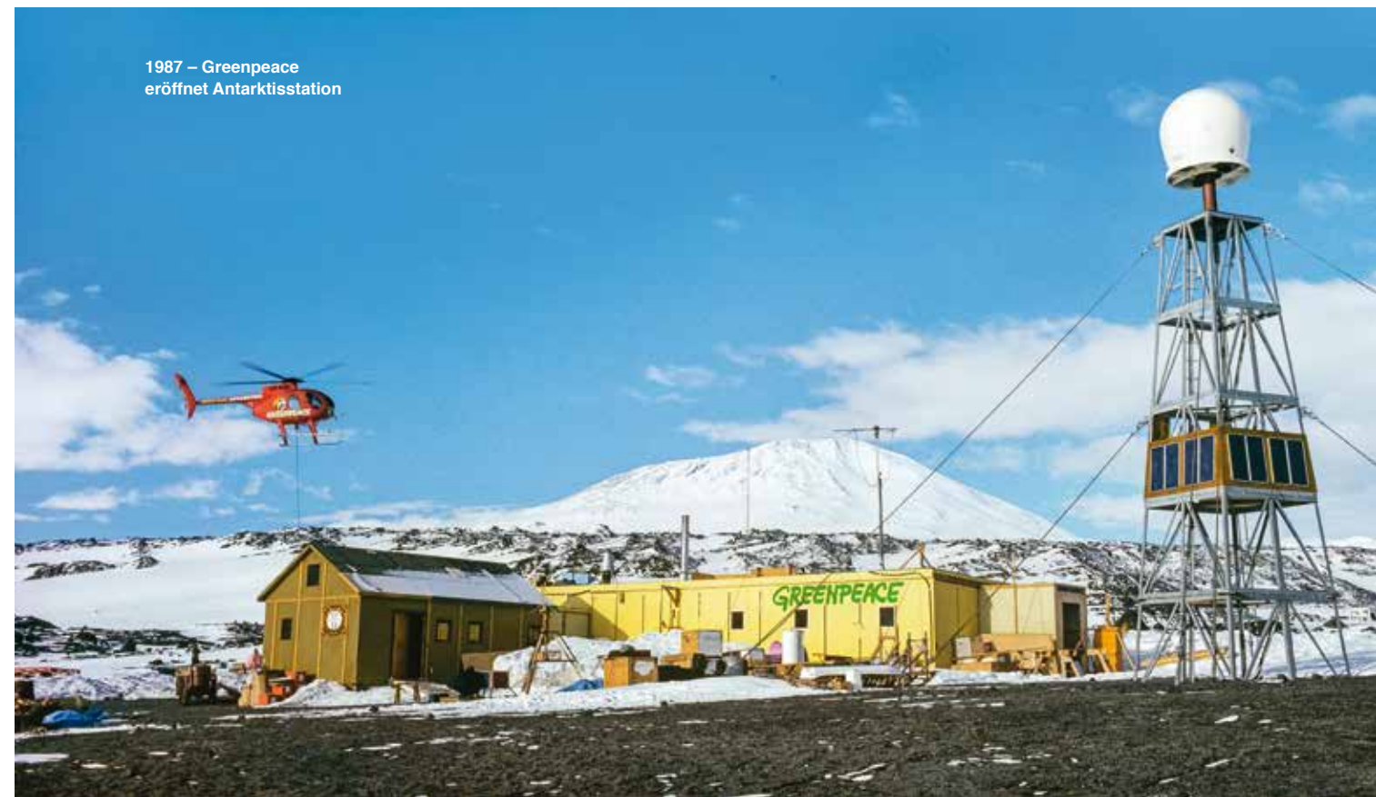
1987 – Greenpeace eröffnet Antarktisstation