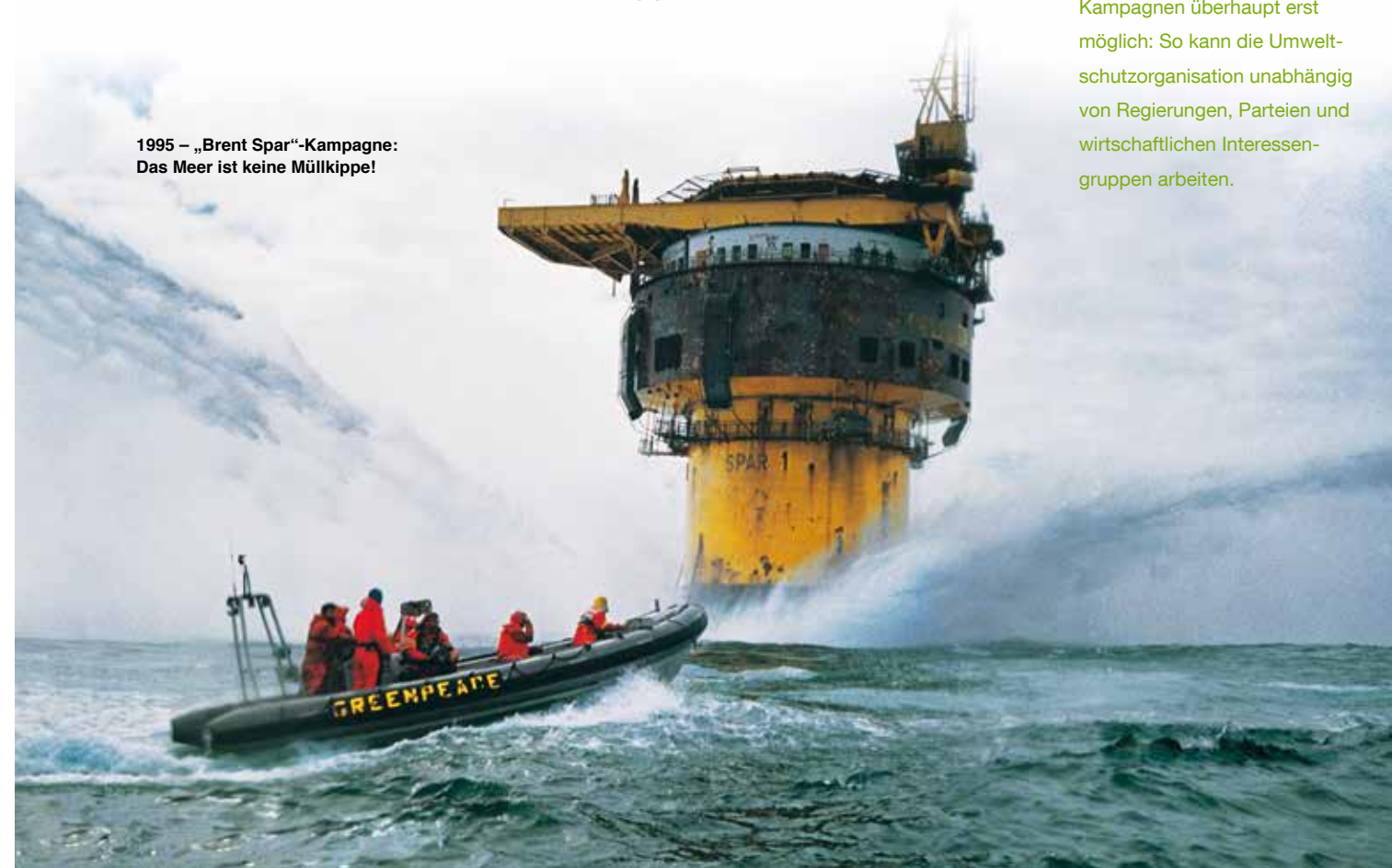
1995 – „Brent Spar“-Kampagne: Das Meer ist keine Müllkippe!

1995 Über Wochen protestieren Greenpeace-Aktivist*innen gegen die geplante Versenkung der ausgedienten Öltank- und Verladeplattform „Brent Spar“ durch Shell im Atlantik. Nach einer Welle der öffentlichen Empörung gibt der Ölmulti nach, die „Brent