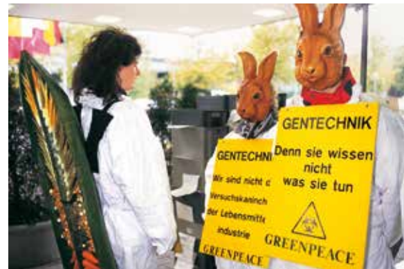
1997 – Greenpeace-Protest gegen Gentechnik in Lebensmitteln

1997 Das EinkaufsNetz, die Verbraucherorganisation von Greenpeace, setzt sich für mehr Sicherheit und Qualität bei Lebensmitteln und Konsumprodukten ein, es arbeitet bis 2006. ▶ Greenpeace beginnt die Kampagne zum Schutz des Great-Bear-Regenwaldes.