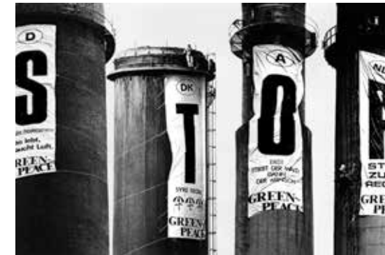
1984 – Protest an Kohlekraftwerken

1984 Greenpeacer*innen protestieren zeitgleich in acht europäischen Ländern an den Schloten von Kraftwerken, um ein Zeichen gegen sauren Regen und Waldsterben zu setzen.