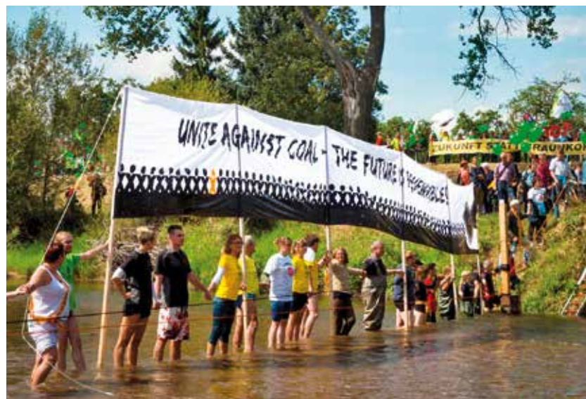
2014 – Lausitz: Demonstration gegen Kohletagebaue

2015 Raus aus den fossilen Energien: Bei der Klimakonferenz in Paris werden ambitionierte Ziele gesetzt. ▶ Proteste von Greenpeace und Verbraucher*innen zeigen Wirkung: Wiesenhof und McDonald's wollen künftig gentechnikfreies Hühnerfutter nutzen.