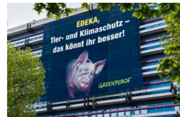
2021 – Protest gegen Edekas Fleischpolitik in Hamburg

2021 Historischer rechtlicher Erfolg: Das Bundesverfassungsgericht erklärt das Klimaschutzgesetz teilweise für verfassungswidrig und stärkt damit das Recht der jungen Generation auf eine lebenswerte Zukunft. Das Urteil erfolgte nach einer von Greenpeace unterstützten Klage von neun jungen Menschen. ▶ Deutschland tritt der “High Ambition Coalition for Nature and People” bei und setzt sich damit dafür ein, weltweit bis 2030 mindestens 30 Prozent der Land- und Meeresflächen zu schützen. ▶ Billigfleisch in Supermärkten wird zum Auslaufmodell – bis auf Kaufland wollen alle großen Händler langfristig kein Frischfleisch der qualvollen Haltungsformen 1 und 2 mehr verkaufen. Die Umstellung des Sortiments läuft: Innerhalb eines Jahres sank laut einer Greenpeace-Abfrage der Anteil der Haltungsform 1 von 69 auf 34 Prozent.