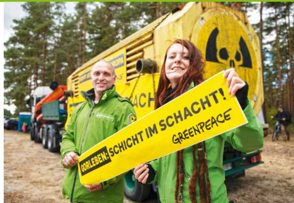
2020 – Gorleben ist Geschichte!

2018 Drei Millionen Menschen fordern mit Greenpeace ein Schutzgebiet im antarktischen Weddellmeer. Teilerfolg: Der Branchenverband der Krillindustrie erklärt, das Weddellmeer und wichtige Wildtiernahrungsgründe um die antarktische Halbinsel zu schonen. ▶ Die brasilianische Umweltschutzbehörde IBAMA erteilt dem französischen Ölkonzern Total eine Absage für Bohrpläne nahe dem Amazonasriff, gegen die sich Greenpeace eingesetzt hatte. ▶ Der Hambacher Wald soll für die Erweiterung des angrenzenden Kohletagebaus weichen – er wird im Herbst 2018 zum Symbol der verfehlten Energie- und Klimapolitik Deutschlands. Greenpeace protestiert mit Zehntausenden Menschen für den Erhalt des Waldes und für den Ausstieg aus der klimaschädlichen Kohleverbrennung.