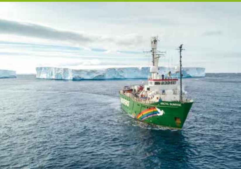
2018 – Greenpeace setzt sich für ein Schutzgebiet im antarktischen Weddellmeer ein

2018 Drei Millionen Menschen fordern mit Greenpeace ein Schutzgebiet im antarktischen Weddellmeer. Teilerfolg: Der Branchenverband der Krillindustrie erklärt, das Weddellmeer und wichtige Wildtiernahrungsgründe um die antarktische Halbinsel zu schonen. ▶ Die brasilianische Umweltschutzbehörde IBAMA erteilt dem französischen Ölkonzern Total eine Absage für Bohrpläne nahe dem Amazonasriff, gegen die sich Greenpeace eingesetzt hatte. ▶ Der Hambacher Wald soll für die Erweiterung des angrenzenden Kohletagebaus weichen – er wird im Herbst 2018 zum Symbol der verfehlten Energie- und Klimapolitik Deutschlands. Greenpeace protestiert mit Zehntausenden Menschen für den Erhalt des Waldes und für den Ausstieg aus der klimaschädlichen Kohleverbrennung.