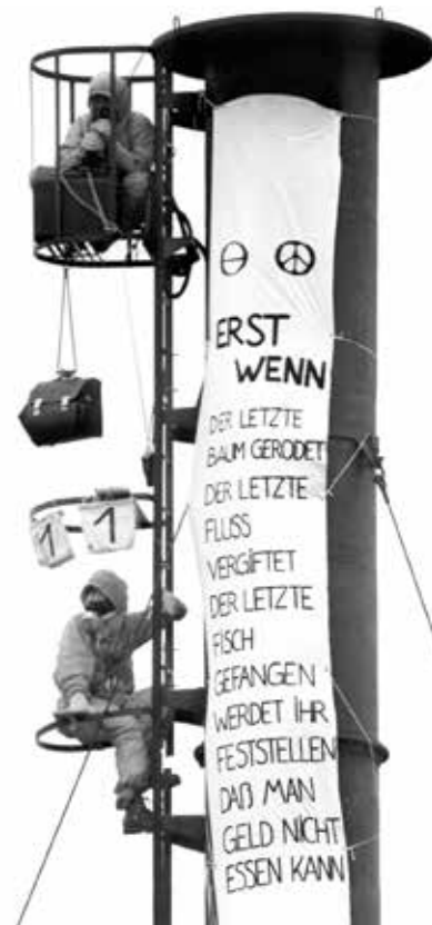
1981 – Greenpeace-Protest gegen die Giftschleuder Boehringer

1983 Der EG-Umweltrat beschließt ein Einfuhrverbot für Jungrobbenfelle – Greenpeace hatte die Kampagne gegen die kommerzielle Robbenjagd Mitte der 70er-Jahre in Neufundland begonnen und weltweit viele Unterstützer*innen für das Anliegen motivieren können. ▶ Start der Arbeit gegen Treibnetzfischerei und Beginn der Antarktiskampagne: Greenpeace fordert einen „Weltpark Antarktis“, um den Kontinent vor Ressourcenabbau und Zerstörung zu bewahren. ▶ Die London Dumping Convention beschließt ein Moratorium gegen die Versenkung von Atommüll im Meer.