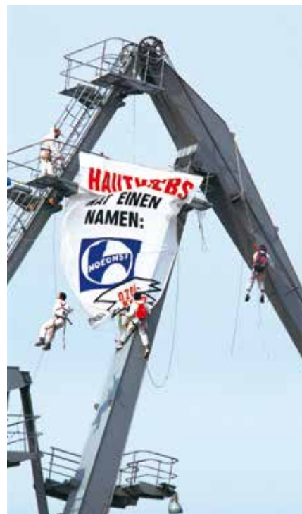
1989 – FCKW-Aktion bei Hoechst

1991 Das Antarktisschutzprotokoll, das den Rohstoffabbau für 50 Jahre verbietet, wird unterzeichnet. ▶ Greenpeace bringt ein Plagiat des „Spiegel“ heraus – auf chlorfrei gebleichtem Tiefdruckpapier. Die Verlage bestritten bis dato, dass das ohne Qualitätsverlust möglich sei. Nun wissen sie es besser. ▶ Die UN beschließen ein weltweites Verbot der Treibnetzfischerei.