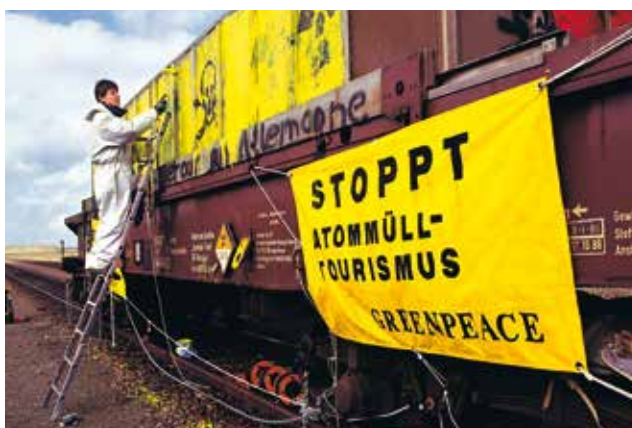
1991 – Protest gegen Atomwaste-transporte quer durch Europa

1992 Greenpeace entwickelt mit einer ostdeutschen Firma den „Greenfreeze“, den ersten Kühlschrank ohne FCKW und FKW – 1993 läuft der erste Ökokühlschrank vom Band, der „Greenfreeze“ startet seinen weltweiten Siegeszug. ▶ Aktivist*innen bringen dem deutschen Umweltminister radioaktiv kontaminierten Sand aus der Umgebung der britischen „Wiederaufarbeitungsanlage“ Sellafield, die auch deutschen Atomwaste verarbeitet.