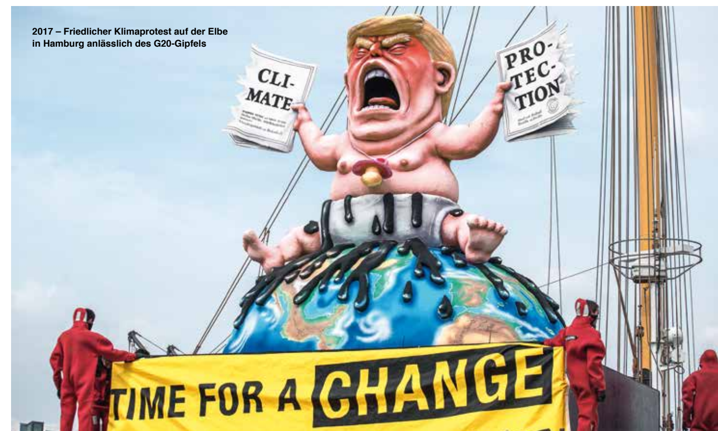
2017 – Friedlicher Klimaprotest auf der Elbe in Hamburg anlässlich des G20-Gipfels