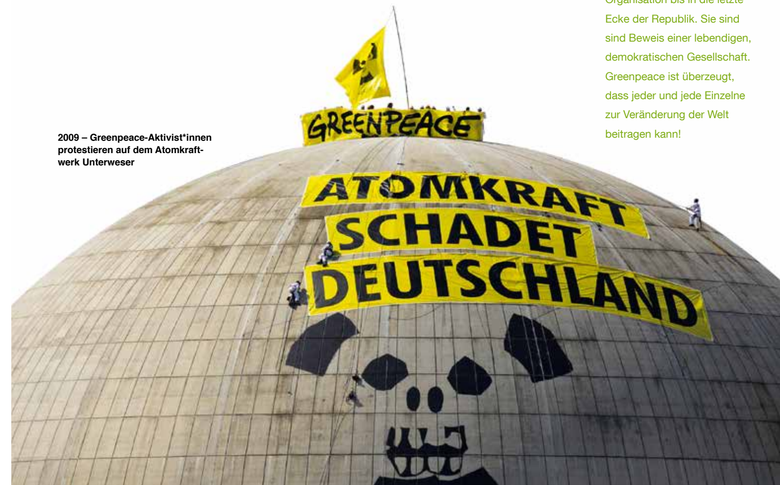
2009 – Greenpeace-Aktivist*innen protestieren auf dem Atomkraftwerk Unterweser

zum kritischen Umgang mit Institutionen und damit gegen Politikverdrossenheit und Resignation. Tausende Kinder, Jugendliche und Erwachsene, die sich ehrenamtlich für Greenpeace-Themen einsetzen, tragen die Arbeit der Organisation bis in die letzte Ecke der Republik. Sie sind ein Beweis einer lebendigen, demokratischen Gesellschaft. Greenpeace ist überzeugt, dass jeder und jede Einzelne zur Veränderung der Welt beitragen kann!